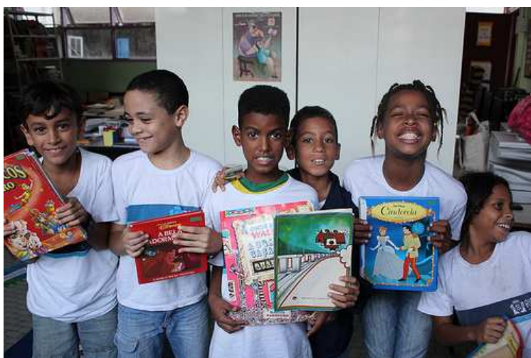
Foto: Leitores da Sala de Leitura Geraldo Jordão Pereira, Escola Santo Tomás de Aquino no Leme, Rio (patrocínio Editora Sextante).