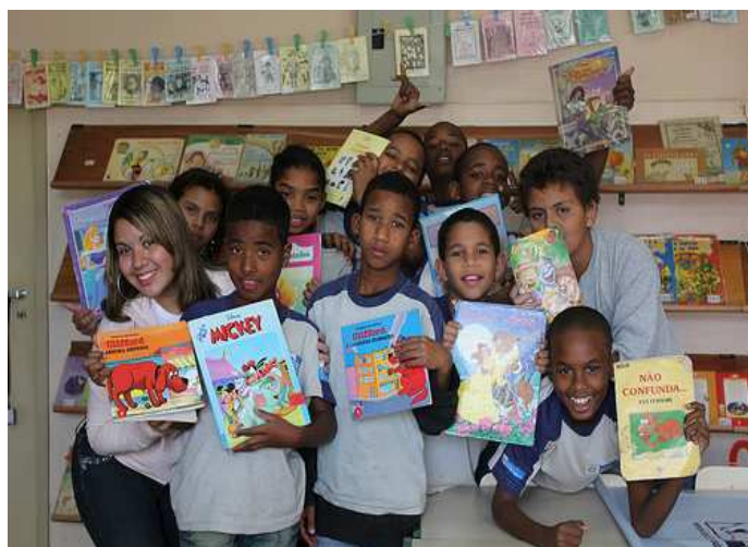
Foto: Sala de Leitura Ziraldo, tutora Cássia, CIEP 200 em Nova Iguaçu.