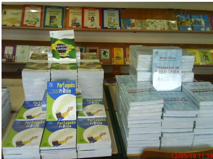
Foto: Outros livros do acervo doado ao CIEP 200.