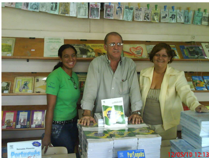
Foto: Diretores do CIEP 200 em Miguel Couto, NI, recebendo os livros de gramática que foram doados pelo HL da Editora Elsevier.

http://www.youtube.com/watch?v=bD_No7zLen0