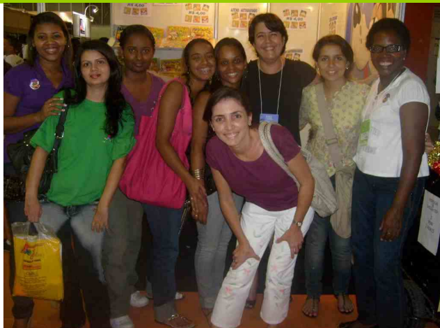
Foto: Equipe do Hora da Leitura se encanta na XIV Bienal do Livro Rio, Setembro 09.

O Hora da Leitura incentiva o prazer de ler e o acesso aos livros para crianças do 2º. ao 5º ano do Ensino Fundamental, sendo uma ação patrocinada pela iniciativa privada que atua na rede de Escolas Públicas do Estado do Rio de Janeiro.