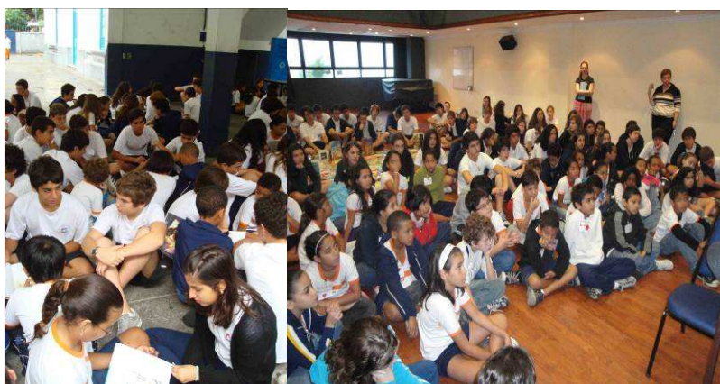
Foto: Hora da Leitura entre alunos da Escola Britânica R.J. Urca e alunos da Escola Municipal Minas Gerais, Setembro 09.