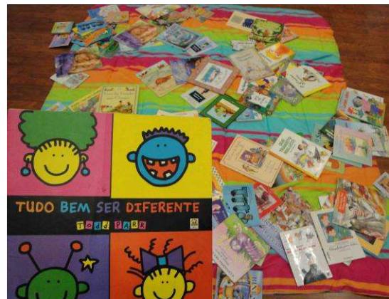
Foto: Livros doados por pessoas físicas e utilizados nas Salas de Leitura, Setembro 09.

Contato: Priscila Mendes no E-mail timetoread@institutodacrianca.org.br