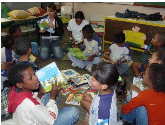
Foto: Sala de Leitura no CIEP 200, Nova Iguaçu, RJ Junho 09.

Escola Britânica RJ da Urca dá exemplo de ação social e consegue unir as pontas.