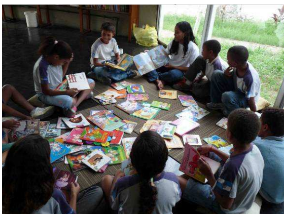
Foto: Sala de Leitura no CIEP 030, São João do Meriti, RJ, Junho 09