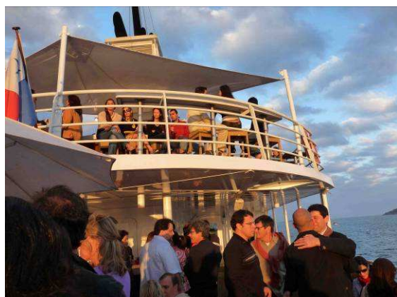
Foto: Navegando pela Baía de Guanabara em prol do Hora da Leitura, 27 Junho 09.