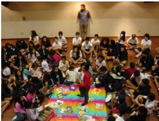
Foto: Hora da Leitura no auditório da Escola Britânica Urca, com alunos da Escola Municipal Minas Gerais e Escola Britânica, 19 Junho 09.