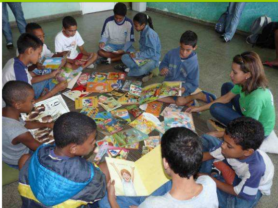
Foto: Sala de Leitura no CIEP 333, Nova Iguaçu, RJ, Junho 09.