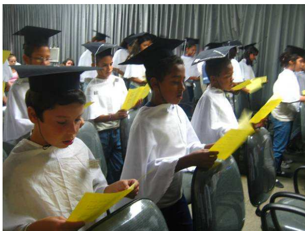
Foto: Formatura do Hora da Leitura de alunos do CIEP 200, em São João de Meriti, 15 Dezembro 09.

Com patrocínio Associação Vencer (Banco Modal).