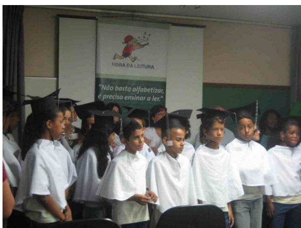
Foto: Formatura do Hora da Leitura de alunos do CIEP 200, em São João de Meriti, 15 Dezembro 09.