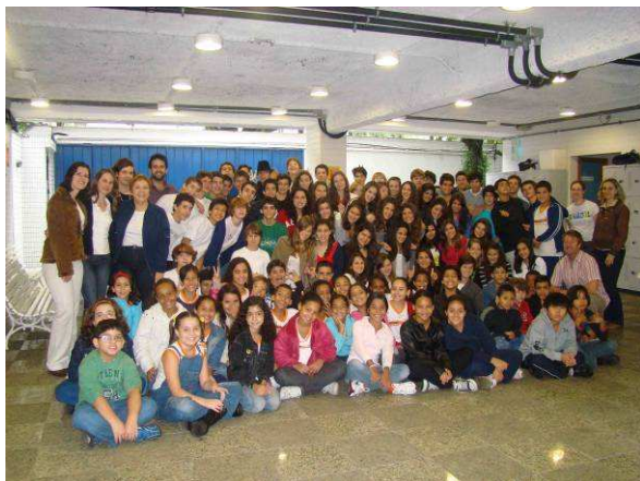
Foto: A turma do 7º. ano da Escola Britânica RJ Urca e a turma do 3º. ano da Escola Municipal Minas Gerais reunidos em parceria com o Hora da Leitura, Dezembro 09.

O Hora da Leitura incentiva o prazer de ler e o acesso aos livros com foco em crianças do 2º. ao 5º ano do Ensino Fundamental, sendo uma ação patrocinada pela iniciativa privada que atua na rede escolar pública no Estado do Rio de Janeiro. O Programa foi iniciado em 18 Agosto 2008.